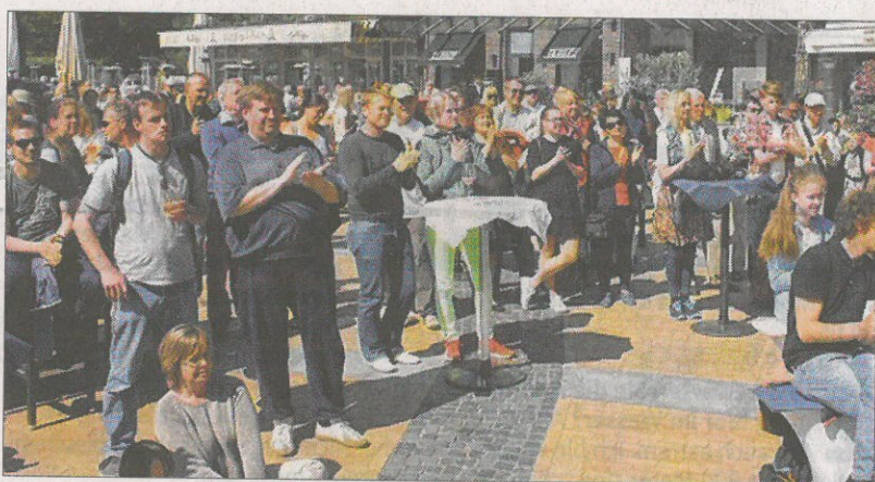
Bei bestem Pfingstwetter gab es für die Hobby-Poeten immer wieder reichlich Applaus des begeisterten Publikums.